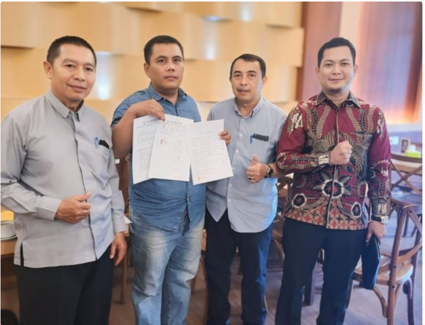
Kuasa Hukum Ningto Wahyu Dens & Partners Lawfirm di perkara Dugaan Pemalsuan Data dan Kredit Fiktif di Bank BRI Unit Kalideres.

JAKARTA, JNI - Seorang bekas nasabah Bank BRI, yang dikenal dengan inisial NW, melaporkan dugaan pemalsuan data dan kredit fiktif yang melibatkan oknum pegawai Bank BRI Unit Kalideres.